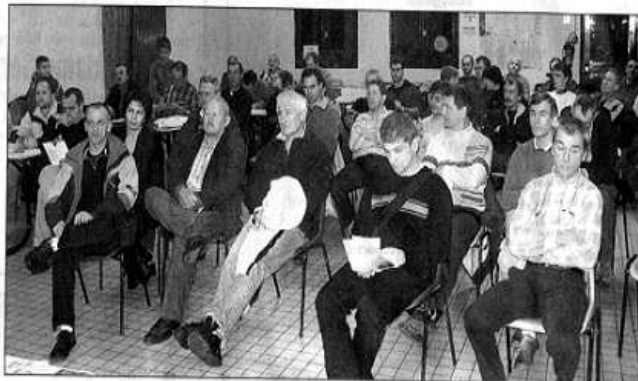
Malgré la baisse d'effectif, le club se porte bien.