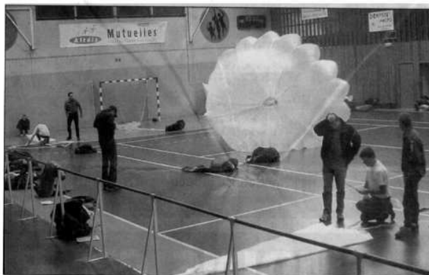
Décors inhabituel dans le Cossec.

Après Nouvion-sur-Meuse en 2003, le club Pointe Ardennes Parapente passe par Bogny pour effectuer son opération annuelle de vérification des parachutes de secours.